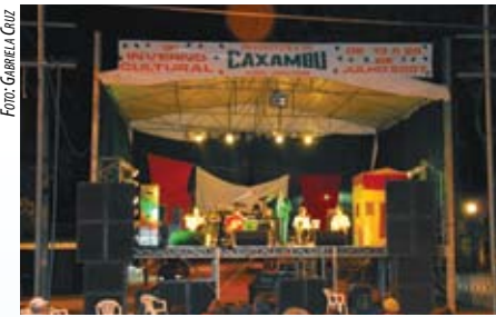
CAXAMBU - PRAÇA PRINCIPAL - INVERNO CULTURAL - JUL 07