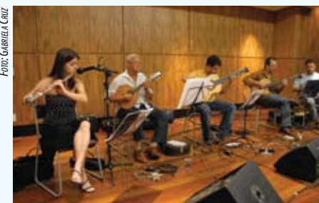
SARAU BRASILEIRO - AUDITÓRIO DA PBH - PROJETO BH NO CHORO - NOV 07