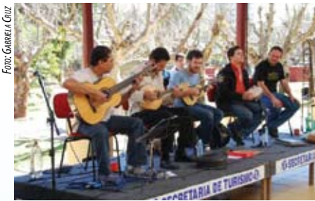
GRUPO FLOR DE ABACATE EM CAXAMBU - INVERNO CULTURAL - JUL 07